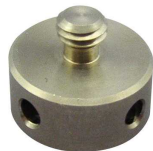
M6 x P1 (オプション)