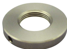
φ32 x 5 (オプション)